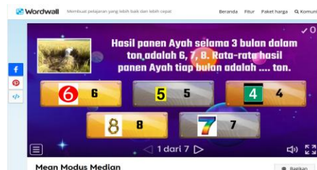
Gambar 1. Tampilan Game Wordwall Gambar 2. Soal kuis dengan Game Wordwall

Perlakuan dalam penelitian ini berupa penggunaan media pembelajaran matematika berbasis game online pada mata kuliah Statistika. Desain penelitian ini dipilih untuk mengetahui pengaruh penggunaan media pembelajaran berbasis game online terhadap peningkatan kemampuan berpikir mahasiswa Teknik Informatika. Perbandingan hasil pretest dan posttest digunakan untuk mengukur perubahan kemampuan berpikir mahasiswa setelah mengikuti proses pembelajaran menggunakan media tersebut. Desain penelitian dapat digambarkan sebagai berikut: