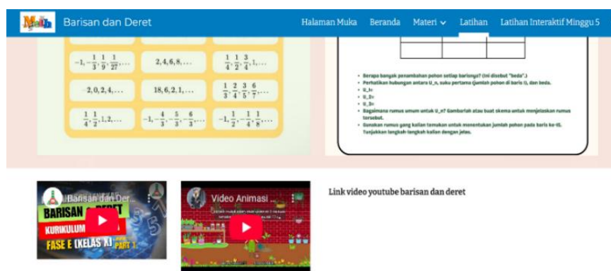
Gambar 4. Konten Video Terlampir di Google Sites

Untuk menjamin kualitas, konsistensi, dan kejelasan penyajian materi, seluruh konten media pembelajaran divalidasi oleh dua rekan sejawat. Hasil validasi disajikan pada Tabel 4.