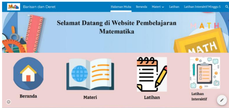
Gambar 1. Halaman Muka Google Sites