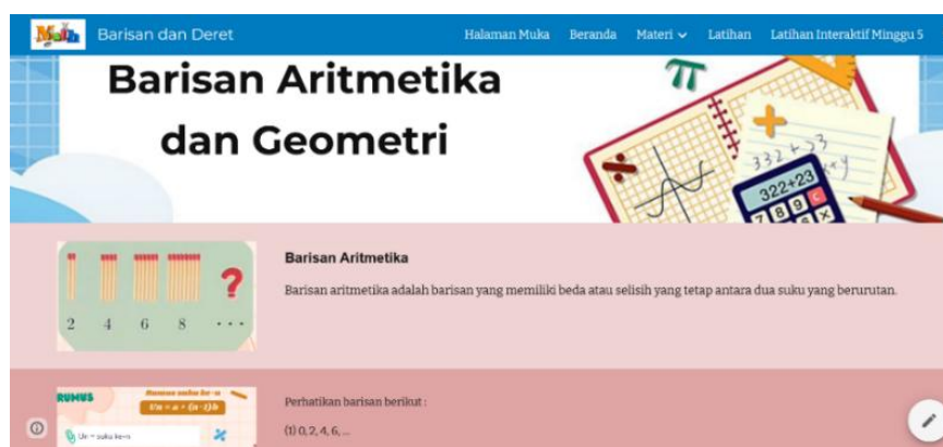
Gambar 2. Halaman Tujuan Pembelajaran

Tahap desain difokuskan pada upaya memastikan kemudahan penggunaan media pembelajaran serta kesesuaian dengan kurikulum yang berlaku. Perhatian khusus diberikan pada fitur aksesibilitas, sehingga siswa dapat mengakses materi pembelajaran kapan pun dan dari lokasi mana pun. Struktur navigasi dirancang secara logis dan intuitif, dengan mempertimbangkan keterpaduan antara konten, media visual, dan interaktivitas. Perancangan ini bertujuan agar pengalaman belajar tidak hanya informatif, tetapi juga efisien dan menyenangkan bagi siswa.