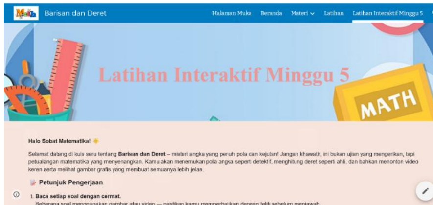
Gambar 5. Halaman Latihan Interaktif