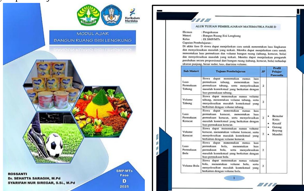
Gambar 2. Tampilan Sampul Produk yang Dikembangkan

Pada tahap ini, modul ajar yang telah dinyatakan valid dan praktis disebarluaskan dalam bentuk hardfile berupa buku yang dikemas rapi. Modul ajar diberikan kepada SMP Negeri 7 Tualang yang berkontribusi pada penelitian ini. Modul ajar yang diberikan diharapkan dapat digunakan dalam proses pembelajaran dan digunakan sebagai referensi untuk pengembangan modul ajar matematika materi lainnya. Berikut gambar tampilan depan dari pengemasan perangkat pembelajaran.