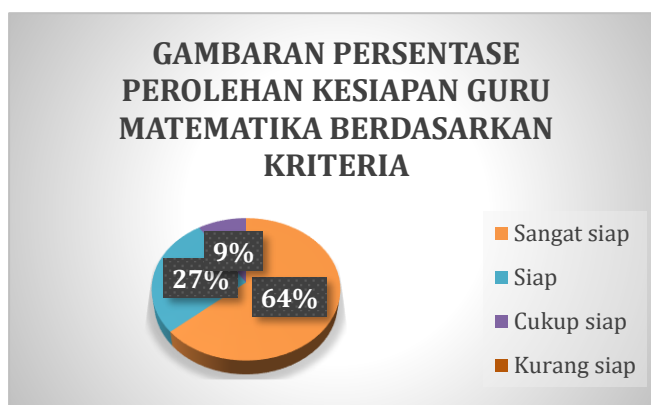
Gambar 1. Persentase Perolehan Kesiapan Guru Matematika Berdasarkan Kriteria

Berdasarkan perolehan data dilihat bahwa secara keseluruhan guru matematika SMA di Kota Gunungsitoli sebanyak 11 orang memiliki kriteria cukup siap dengan persentase 9%, 8 orang memiliki kriteria jawaban yang siap dengan persentase 73% dan 3 orang yang memiliki kriteria jawaban yang sangat siap dengan persentase 27%. Pada gambar berikut merupakan perolehan persentase kesiapan guru matematika.