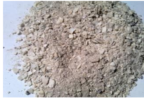
Gambar 4. Kulit Tiram yang dihancurkan

mesin tersebut. Gambar 3 adalah gambar Tiram yang dibakar, limbah dari olahan makanan tersebut yang akan dijadikan sebagai pasir berdasarkan gambar 4 kulit tiram