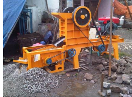
Gambar 2. Wujud nyata proses kerja mesin

sebagai tambahan bahan gunakan batu apabila ada. Gunakan ember yang telah disiapkan untuk menampung kulit tiram yang sudah di pabrik.