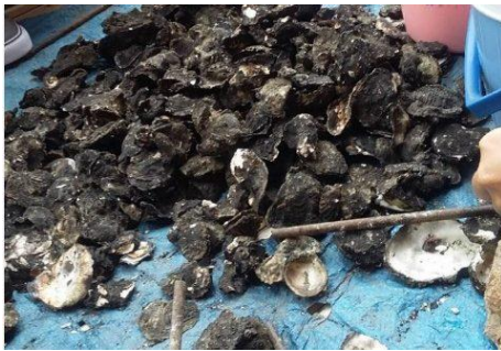
Gambar 3. Tiram bakar

Berdasarkan gambar diatas dapat dilihat cara pengolahan Limbah tiram menjadi pasir dengan menggunakan mesin penghancur. Gambar 1 adalah gambar bagaimana proses penghancuran tiram melalui