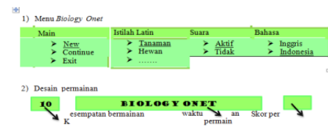
Gambar 1 Menu Biologi Onet