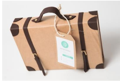
Gambar 5. Kemasan Luar Serial Yogya Komik