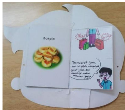
Gambar 1. Komik “Bakpia” tanpa AR