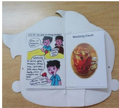
Gambar 3. Komik “Wedang Uwuh” tanpa AR