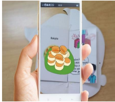
Gambar 2. Komik “Bakpia” dengan AR