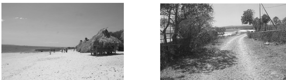
Gambar 5. Kondisi pantai Tablong dan akses jalan menuju ke tempat destinasi wisata