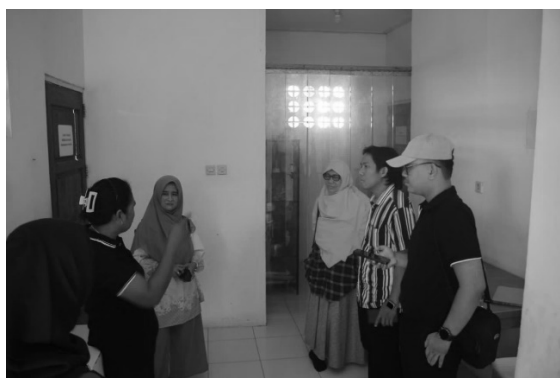
Gambar 6. Wawancara dengan pelaku usaha rumput laut

Selain itu, di sekitar kawasan wisata Pantai Tablong dan Pantai Sulamanda tidak terdapat penginapan/hotel, sehingga pengunjung harus menempuh perjalanan sekitar 1-2 jam dari penginapan atau hotel terdekat untuk menuju ke pantai.