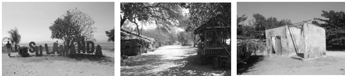
Gambar 4. Kondisi pantai, kegiatan UMKM yang sepi dari pengunjung dan fasilitas umum yang rusak di Pantai Sulamanda