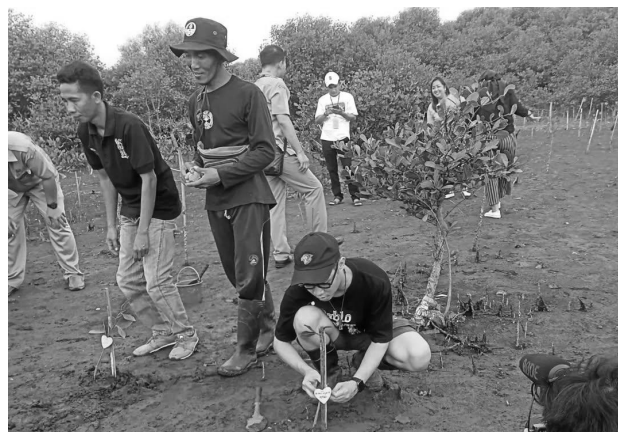
Gambar 3. Penanaman dan Pemeliharaan Mangrove

Dalam setiap pelaksanaannya keterlibatan akademisi juga menjadi kunci suatu kegiatan wisata. Akademisi menjadi mitra pengembangan dan pengetahuan di tingkat akademik. Hal itu mampu menarik minat pembelajaran melalui wisata. Mahasiswa Pecinta Alam (MAHASPALA) Universitas PGRI Situbondo juga sering melakukan kegiatan untuk membantu pengembangan wisata.