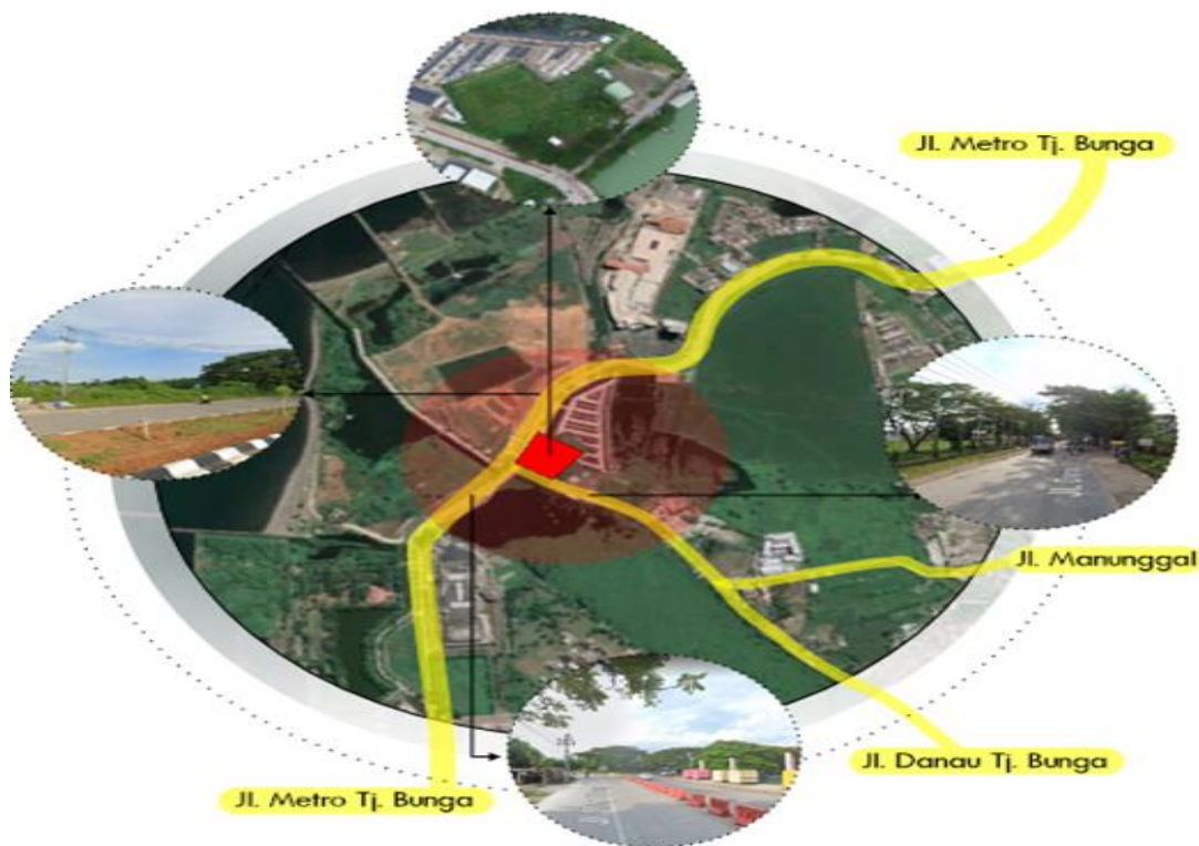
GAMBAR 1 Kondisi Exsisting Lokasi

Tamalanrea, Biringkanaya, Manggala, Panakukang, Tallo, Ujung Tanah, Bontoala, Wajo, Ujung Pandang, Makassar, Rappocini, Tamalate, Mamajang dan Mariso.