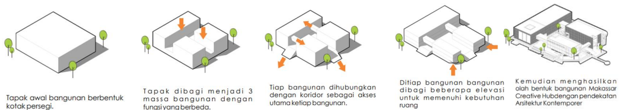
GAMBAR 3 Transfotmasi Bentuk Bangunan

Material utama yang digunakan pada fasad bangunan Creative Hub dengan konsep Arsitektur Kontemporer ini adalah KISI KISI Wood Plastic Composite (WPC) dan Polycarbonate Translucent Facada yang dapat dilihat pada gambar di bawah.