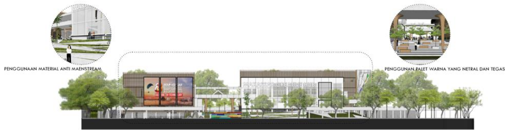
GAMBAR 5 Tema Perancangan