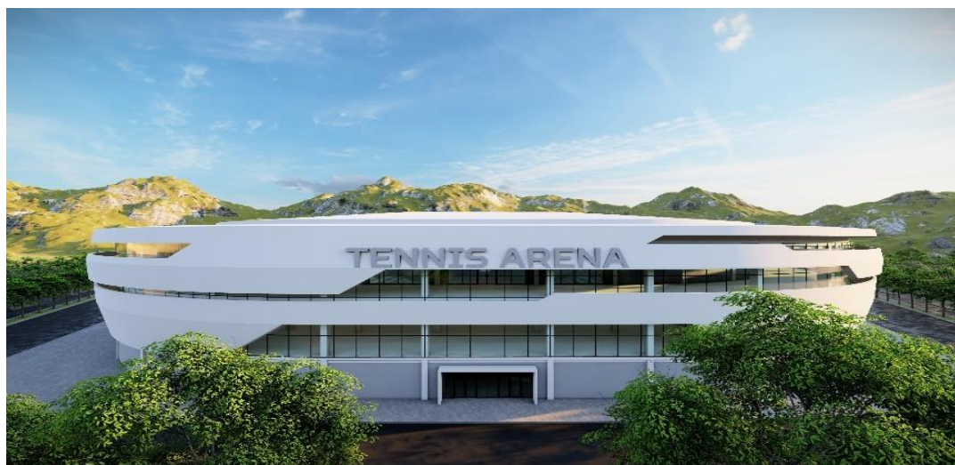
GAMBAR 4 Tampak Gedung Olahraga