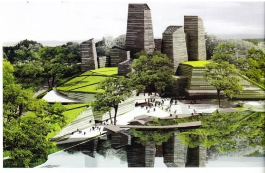
Gambar 1.5 Crystal of Knowledge

Perpustakaan ini merupakan pengembangan dari perpustakaan pusat yang dibangun pada tahun 1986-1987, yang dibangun di area seluas 3 hektar dengan 8 lantai, dirancang berdiri diatas bukit buatan yang terletak di pinggir danau. Perpustakaan ini menganut konsep (Eco Building), Kebutuhan energi menggunakan sumber energy terbarukan yaitu energi matahari (solar energy). Dengan konsep ini semua kebutuhan didalam gedung tidak diperbolehkan menggunakan plastic dalam bentuk apapun dan bangunan ini didesain bebas asap rokok, hemat listrik, air dan kertas. (Yogiesti et al., 2010)