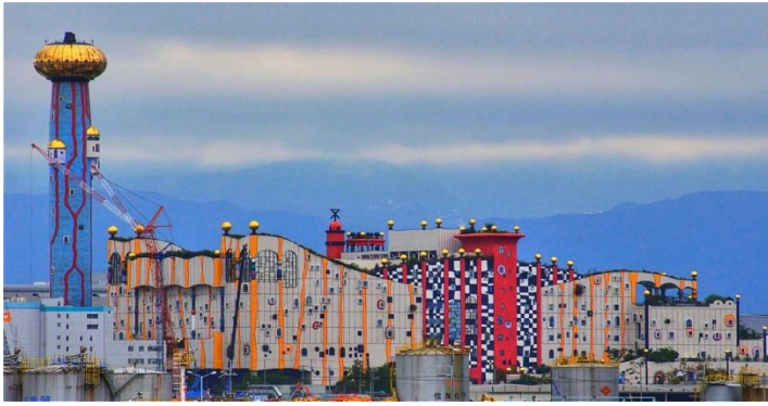
Gambar 1.3 Maishima Incinerator Osaka Jepang