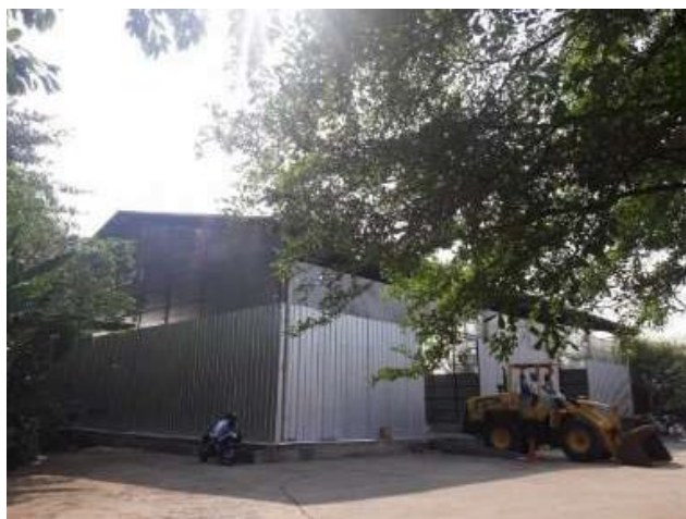
Gambar 1.1 Jakarta Recycle Center (JRC)

TPST UNES merupakan tempat pengolahan sampah organik yang dikelola dan dipegang secara langsung oleh UPT pengembang konservasi UNNES. TPST ini berlokasi di Gang Ki Ageng Gribik, Sekaran, Gunungpati, atau berada di seberang Gerbang Utama UNNES. Selain mengumpulkan dan mengolah sampah dari lingkungan kampus, UNNES juga mengelola sampah dari masyarakat sekitar. Sampah-sampah ini dikumpulkan lalu kemudian dipilah dan disortir kemudian diolah menjadi produk yang bermanfaat dan memiliki nilai jual. Pada pengolahan ini juga memanfaatkan sampah menjadi pakan maggot. Hal tersebut dipilih untuk dijadikan sebagai media pengolahan sampah organik karena maggot memiliki nilai jual yang tinggi dan banyak dicari. Pada Gambar 1.2