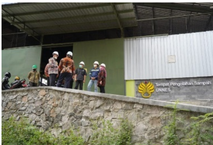
Gambar 1.2 Jakarta Recycle Center (JRC)