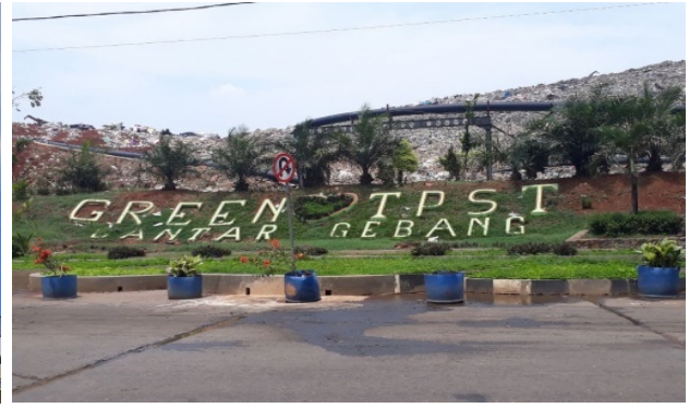
Gambar 1.4 Tempat Pengolahan Sampah Terpadu Bantargebang