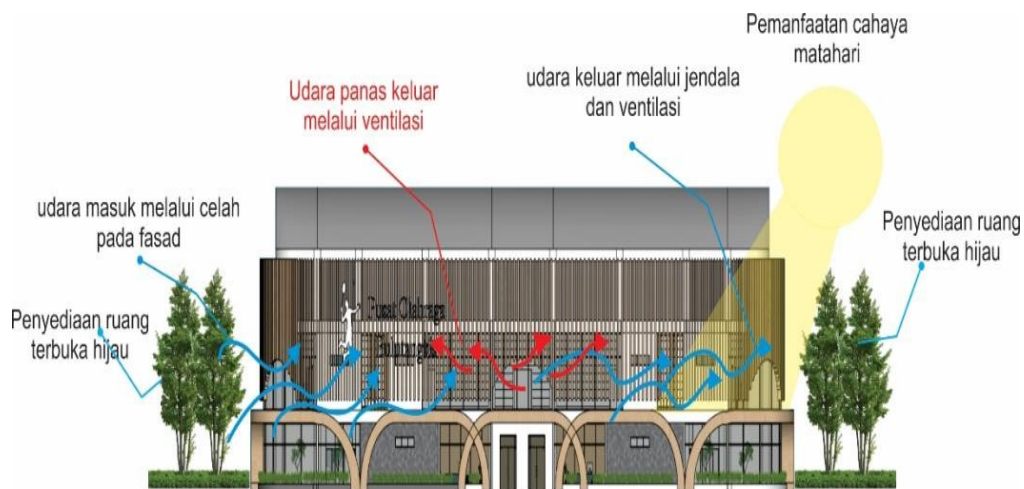
GAMBAR2 Penerapan Prinsip Ekologi

Adapun prinsip ekologi yang di terapkan pada Perancangan Pusat Olahraga Bulutangkis yaitu Pemanfaatan potensi iklim dimana pengolahan tata massa bangunan agar mendapatkan penghawaan alami dan juga pencahayaan alami guna mengurangi penggunaan energi listrik.