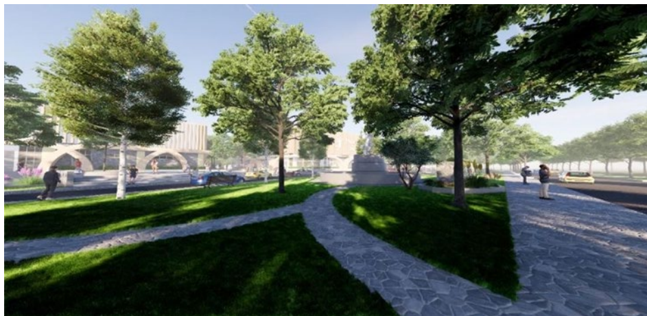
GAMBAR 7 Area Depan.