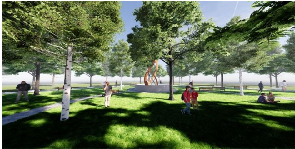
GAMBAR 6. Taman