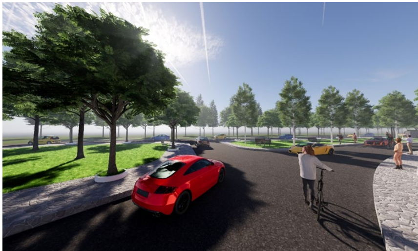
GAMBAR 10 Akses Keluar