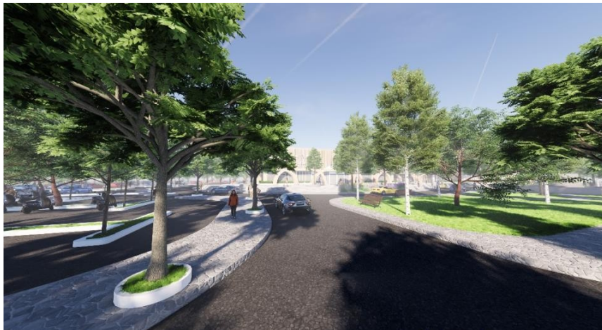
GAMBAR 9 Akses Masuk