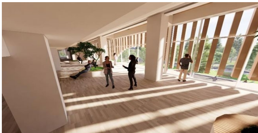
GAMBAR4 Penghawaan alami