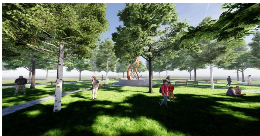
GAMBAR 11 Area Refreshing