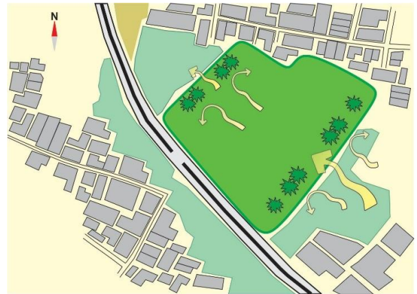
GAMBAR 5 Konsep Arah Angin