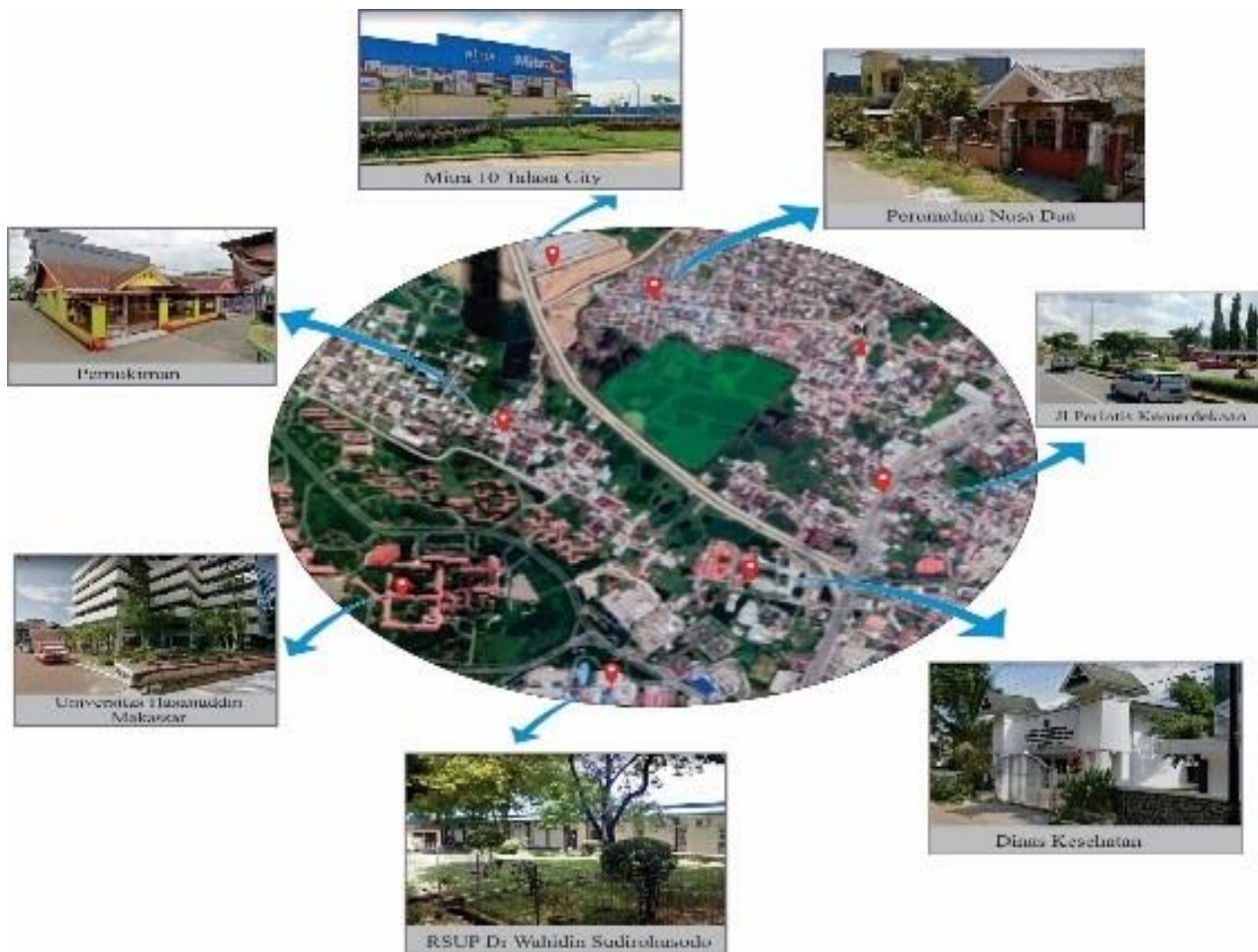
GAMBAR 1 Lokasi Kota Makassar