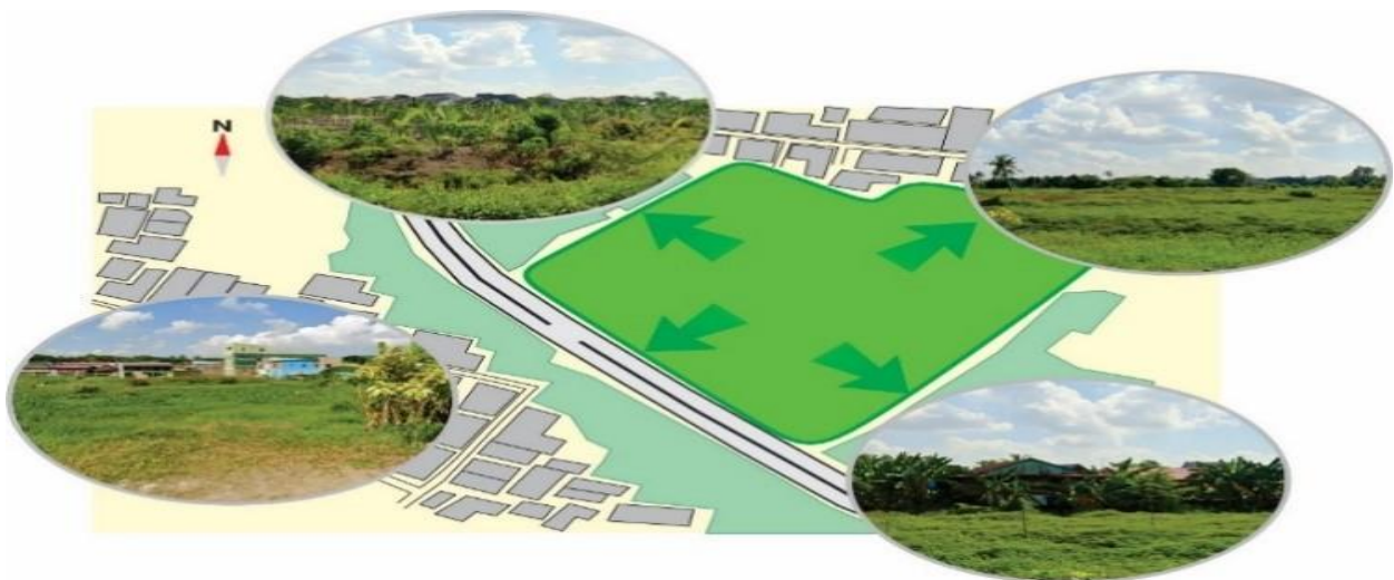
GAMBAR 6 Konsep View

View keluar tapak yang menjadi titik penting adalah sepanjang Jl. Jalur Lingkar Barat dikarenakan area tersebut merupakan akses utama menuju tapak. Disamping itu bangunan di sekitar tapak berdampingan langsung dengan pemukiman dan lahan kosong, sehingga prioritas dari view ke dalam tapak adalah dari jalan utama dengan mengoptimalkan perancangan desain yang menarik dan unik sesuai tema dan fungsi bangunan. Elemen fasad bangunan yang sekaligus merupakan komponen yang mempengaruhi fasad bangunan yaitu atap, dinding dan lantai. Dengan pemanfaatan bentuk bangunan yang di rancang sedemikian rupa mengikuti dari fungsi bangunan sehingga memaksimalkan view dari luar bangunan ke dalam bangunan yang menjadi titik fokus dalam pengatan dan memaksimalkan potensi dari view bangunan.