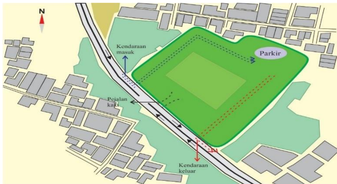
GAMBAR 3 Konsep Sirkulasi

Jalan utama lokasi yaitu Jl.Jalur Lingkar barat yang merupakan jalan penghubung antara Jl.Perintis Kemerdekaan dan Jl.Tol Insinyur Sutami yang berfungsi untuk mengurangi volume lalu lintas di pusat kota dan membaginya dalam dua pola sirkulasi yaitu, Pada sirkulasi kendaraan dibagi menjadi dua yaitu; Mobil, Sepeda Motor yang memiliki jalur sirkulasi yang sama namun area parkir dibedakan agar lebih teratur. Kemudian untuk jalur masuk berada pada arah Barat sedangkan Jalur keluar pada arah Selatan dan Pada perancangan ini sirkulasi diterapkan dengan satu arah agar memudahkan pejalan kaki mecapai tujuannya tanpa mengganggu aktifitas sirkulasi yang lain. Pemanfaatan vegetasi sebagai penunjuk arah jalan dan pelindung hawa panas.