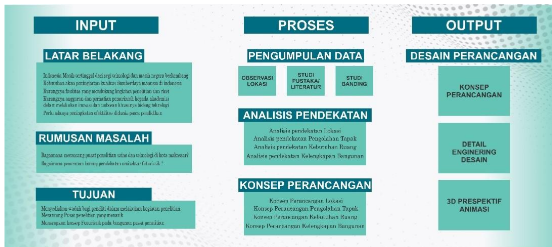
GAMBAR 2 Alur Logika Perancangan

Selanjutnya adalah menentukan instrumen yang akan dilakukan pada saat melakukan Pengumpulan data sebuah penelitian. Tentunya memiliki kebutuhan sesuai dengan metode yang digunakan seperti pada penelitian ini menggunakan instrumen Kuisisioner, Wawancara, Observasi, dan Dokumentasi.