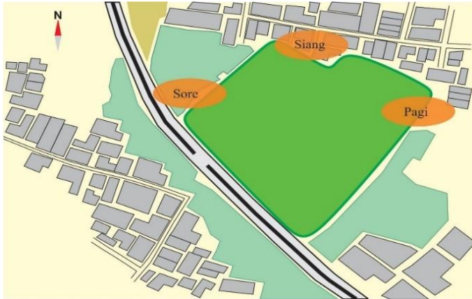
GAMBAR 4 Konsep Orientasi Matahari

Sumber hembusan angin yang dominan dari arah selatan. Maka dari itu upaya yang dilakukan adalah dengan memecah angin keluar dan kedalam tapak. Untuk perencanaan vegetasi digunakan tanaman berupa pohon dengan ciri mempunyai daun lebat dan mempunyai nilai keindahan dan arsitektural.