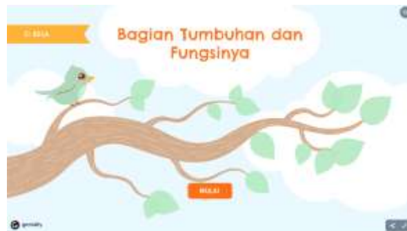
Gambar 2. Tampilan awal aplikasi Si Bela

Penerapan pembelajaran dengan memanfaatkan aplikasi asisten belajar (Si Bela) dilaksanakan di SDN Rojopolo 07, Kecamatan Jatiroto. Aplikasi ini diterapkan pada peserta didik kelas V yang berjumlah 20 orang, dipilih secara heterogen. Penerapan aplikasi asisten belajar (Si Bela) fokus pada muatan pelajaran IPA dengan materi perkembangbiakan tumbuhan. Pengembangan aplikasi ini menggunakan platform Genially dan kemudian diubah menjadi aplikasi berbasis gawai melalui program web to APK. Untuk mengakses aplikasi ini, peserta didik memerlukan smartphone atau laptop. Aplikasi asisten belajar (Si Bela) tersebut terbagi menjadi beberapa bagian sebagai berikut: