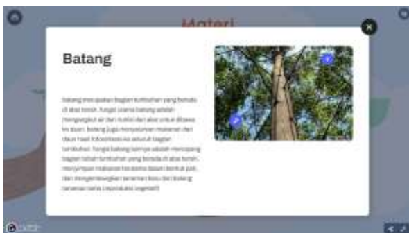
Gambar 4. Tampilan materi aplikasi Si Bela

terkait materi yang telah dipelajari. Adanya pilihan-pilihan ini memberikan fleksibilitas kepada peserta didik untuk menyesuaikan pembelajaran sesuai kebutuhan mereka, menciptakan pengalaman belajar yang lebih terarah dan beragam melalui aplikasi Si Bela.