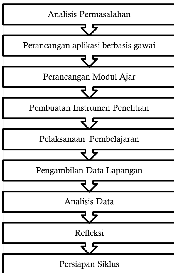
Gambar 1. Bagan Tahapan Penelitian

Sumber data yang digunakan dalam penelitian ini meliputi tiga aspek utama. Pertama, data peserta didik diperoleh melalui tes kemampuan literasi digital sebelum dan setelah menggunakan aplikasi SI BELA. Tes ini memberikan gambaran tentang perkembangan kemampuan literasi digital peserta didik seiring dengan penggunaan aplikasi. Kedua, data observasi diperoleh dari pengamatan langsung terhadap proses pembelajaran di kelas. Observasi ini mencakup interaksi antara peserta didik dan materi pembelajaran serta penerapan teknologi SI BELA dalam konteks pembelajaran sehari-hari. Terakhir, data refleksi berasal dari evaluasi guru terhadap pelaksanaan pembelajaran dan pencapaian peserta didik. Refleksi ini mencerminkan pemahaman guru terhadap efektivitas aplikasi SI BELA dalam meningkatkan literasi digital peserta didik serta