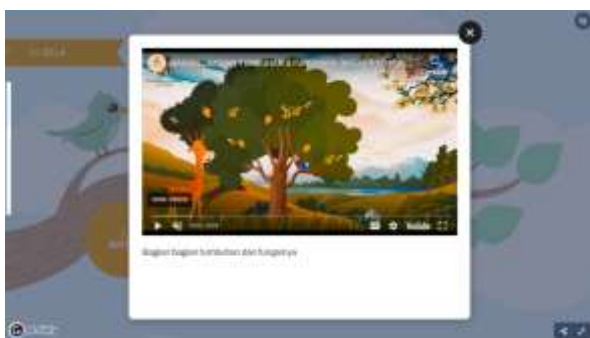
Gambar 5. Tampilan video pembelajaran aplikasi Si Bela

Bagian materi dalam aplikasi Si Bela menyajikan informasi yang komprehensif mengenai berbagai bagian tumbuhan beserta fungsinya. Materi ini mencakup penjelasan tentang bagian-bagian utama tumbuhan, seperti batang, bunga, buah, akar, dan daun. Peserta didik akan diajak untuk memahami peran masing-masing bagian tersebut dalam kehidupan tumbuhan, serta bagaimana interaksi antarbagian tersebut mendukung pertumbuhan dan perkembangan tumbuhan secara keseluruhan. Dengan penyajian materi yang jelas dan informatif, diharapkan peserta didik dapat mengembangkan pemahaman yang mendalam tentang struktur dan fungsi tumbuhan melalui penggunaan aplikasi Si Bela.