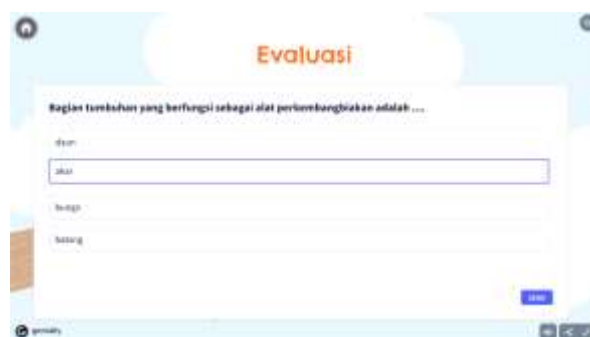
Gambar 6. Tampilan evaluasi aplikasi Si Bela

Di dalam menu video pembelajaran, peserta didik akan mendapatkan materi tentang berbagai bagian tumbuhan dan fungsinya yang disajikan dalam format video. Video ini dirancang untuk memberikan pengalaman belajar yang lebih dinamis dan interaktif. Melalui format visual yang menarik, peserta didik dapat menyaksikan penjelasan yang jelas dan ilustratif tentang struktur serta fungsi dari setiap bagian tumbuhan, termasuk batang, bunga, buah, akar, dan daun. Pemanfaatan video pembelajaran dalam aplikasi Si Bela bertujuan untuk memberikan pengalaman belajar yang lebih beragam dan mendalam bagi peserta didik. Tujuan utamanya adalah memperkaya pemahaman peserta didik terhadap materi pembelajaran, memfasilitasi proses pembelajaran diferensiasi, dan meningkatkan efektivitas proses pembelajaran secara keseluruhan. Dengan menyajikan materi dalam bentuk video, peserta didik memiliki kesempatan untuk memahami konsep secara visual, mendengar penjelasan, dan melibatkan indra penglihatan mereka. Selain itu, penggunaan video dapat memberikan variasi dalam penyampaian informasi, menjadikan pembelajaran lebih menarik dan mengaktifkan keterlibatan peserta didik. Dengan demikian, penerapan video pembelajaran dalam aplikasi Si Bela diharapkan dapat menciptakan lingkungan pembelajaran yang dinamis dan efektif bagi peserta didik.