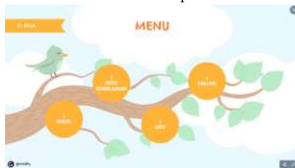
Gambar 3. Tampilan menu aplikasi Si Bela

Saat peserta didik masuk ke aplikasi Si Bela, layar menampilkan halaman awal yang mencakup judul materi yang akan dipelajari, serta dilengkapi dengan tombol "MULAI". Untuk memulai proses pembelajaran menggunakan aplikasi Si Bela, peserta didik perlu menekan tombol "MULAI". Dengan menekan tombol ini, mereka akan diarahkan ke bagian selanjutnya yang memuat konten interaktif dan materi pembelajaran yang disajikan secara menarik. Langkah ini memastikan bahwa peserta didik dapat memulai pengalaman belajar mereka dengan mudah dan efisien melalui aplikasi Si Bela.