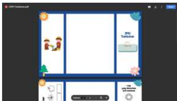
Gambar 7. Tampilan LKPD aplikasi Si Bela

terintegrasi dalam aplikasi asisten belajar Si Bela. Proses evaluasi ini memungkinkan peserta didik untuk mengukur pemahaman mereka terhadap materi yang telah dipelajari. Keunikan dari sistem evaluasi ini terletak pada integrasinya dengan aplikasi Si Bela, sehingga peserta didik dapat dengan cepat dan langsung melihat hasil atau perolehan nilai mereka. Soal evaluasi berbentuk pilihan ganda dengan jumlah 10 butir soal, secara instan setelah menyelesaikan evaluasi, peserta didik akan mendapatkan informasi mengenai sejauh mana mereka telah memahami materi pembelajaran. Hal ini tidak hanya memberikan umpan balik secara langsung, tetapi juga memberikan kesempatan bagi peserta didik untuk melakukan refleksi atas kemajuan mereka serta mengidentifikasi area yang perlu ditingkatkan dalam pemahaman materi tersebut. Dengan adanya sistem evaluasi yang terintegrasi, aplikasi Si Bela memberikan pengalaman pembelajaran yang holistik dan memberikan informasi yang cepat dan akurat kepada peserta didik.