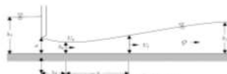
Gambar 2. Parameter aliran pada pintu sorong

Parameter hidrolis pada penelitian ini dalam gambar berikut :