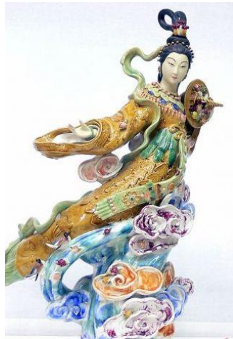
Gambar 3. Lan Ts'ai-ho Terbang di Atas Awan

Penulis mengambil Taoisme sebagai acuan untuk mempelajari budaya Cina yang masuk ke Cirebon Berikut merupakan benda seni dari Cina yang merupakan benda seni dari Cina yang menggunakan simbol Taoisme.