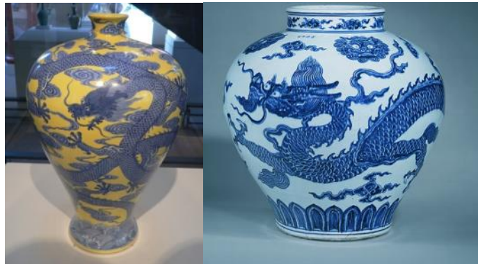
Gambar 2: Keramik-keramik Cina

Motif Mega Mendung yang terdapat di Cirebon ini adalah motif Mega Mendung klasik. Motif Mega Mendung di keraton Kasepuhan ini telah ada sejak Sunan Gunung Jati menyebarkan agama Islam di wilayah Cirebon pada jaman kesultanan keraton. Batik ini tercipta pada saat Sunan Gunung Jati menyebarkan agama Islam yang berasal dari kaligrafi diolah menjadi batik. Dahulu motif ini hanya digunakan oleh kalangan tertentu saja (oleh raja-raja). Pakaian adat keraton, sebagai pakaian putri keraton atau priayi-priayi keraton, sebagai pakaian untuk penari topeng, upacara tradisi. Biasanya pada jaman dahulu untuk menciptakan suatu motif Mega Mendung mendapat ide yang di adopsi dari keramik-keramik Cina yang dibawa oleh Putri Ong Tien.