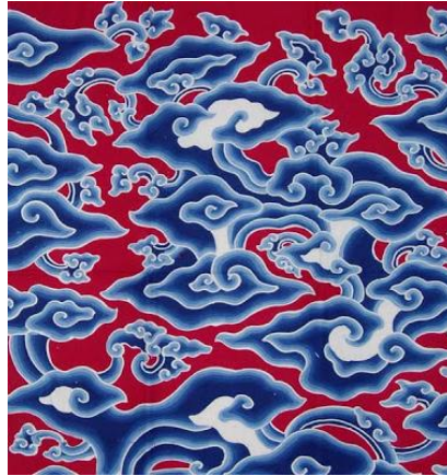
Gambar 1. Motif Mega Mendung

Motif Cina ini hanya sebagai inspirasi. Seniman batik Cirebon kemudian mengolahnya dengan cita rasa masyarakat setempat yang mayoritas beragama islam. Dari situ, lahirlah motif batik dengan ragam hias dan keunikan khas tersendiri.