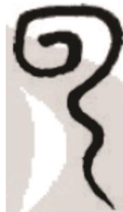
Gambar 4. Yun atau Awan

Pada benda-benda seni tersebut terlihat motif dan ukiran yang menyerupai Mega Mendung. Bentuk-bentuk yang menyerupai awan dengan garis spiral diduga merupakan awal mula inspirasi lahirnya motif Mega Mendung. Berikut merupakan simbol dari karakter Cina yang memiliki hubungan dengan motif Mega Mendung