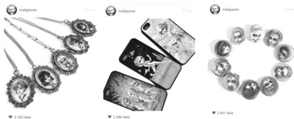
Gambar 7. Seorang ilustrator luar negeri bernama Mab Graves yang menjual ilustrasinya dengan mengaplikasikannya kedalam media nyata dan dijual melalui media maya Instagram.

Keberadaan pasar terbuka ini memudahkan seniman muda dalam geliat urban untuk menyatakan eksistensi diri melalui pasar seni visual maya yang memberikan fasilitas tersebut. Joost Smiers menyetujui keberadaan pasar bebas yang terbuka ini dalam kalimatnya “segelintir seniman laku keras di pasar “terbuka” atau sejumlah galeri seni kontemporer yang terbatas hingga sulit ditemukan di Dunia Barat” (p.63: 2009).