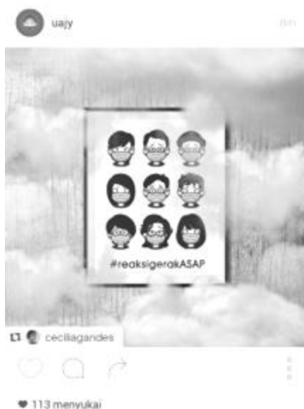
Gambar 8. Ilustrator dan komikus melakukan pengkritikan terhadap gejala fenomena asap di Kalimantan sebagai issue hangat yang diperbincangkan di Indonesia