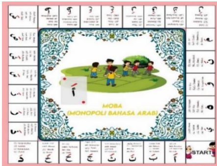
Gambar 1. Kosa Kata Bahasa Arab

berkesempatan untuk melangkah ke level selanjutnya.