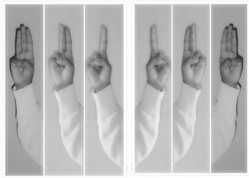
Gambar II Contoh Penggunaan Tangan Kanan dan Kiri dalam Pembelajaran Qawa'id

Begitupun dalam materi kata kerja (فعل), dosen mengatakan bahwa: